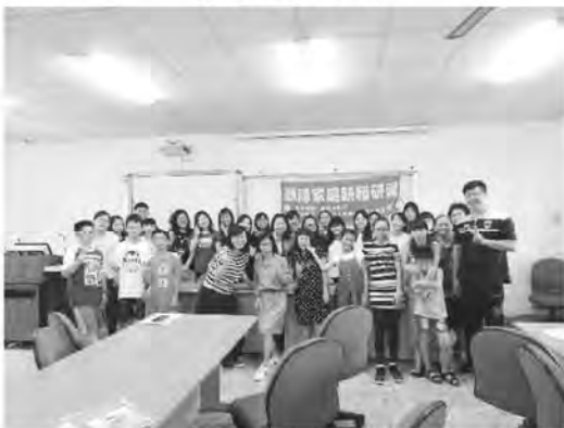
聽障生教材教法課程及家長見面會