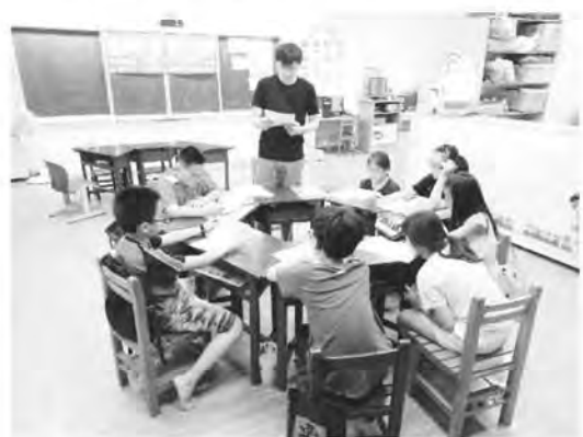
聽障有礙學習無礙語文訓練課程