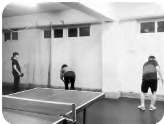
桌球潛能培訓-基本功打底