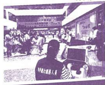
中秋愛心商品促銷記者會~同步聽打