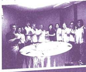
第14屆第3次理監事會