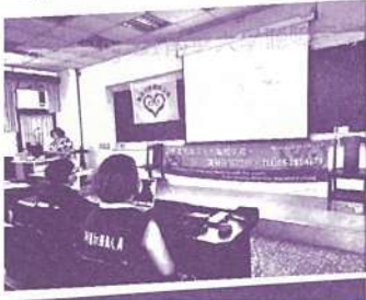
南華大學校園宣導，同步聽打服務

9/27理事長、總幹事帶領20位會員朋友們至中正公園參加嘉義市愛鄉善會盈月圓中秋情活動。