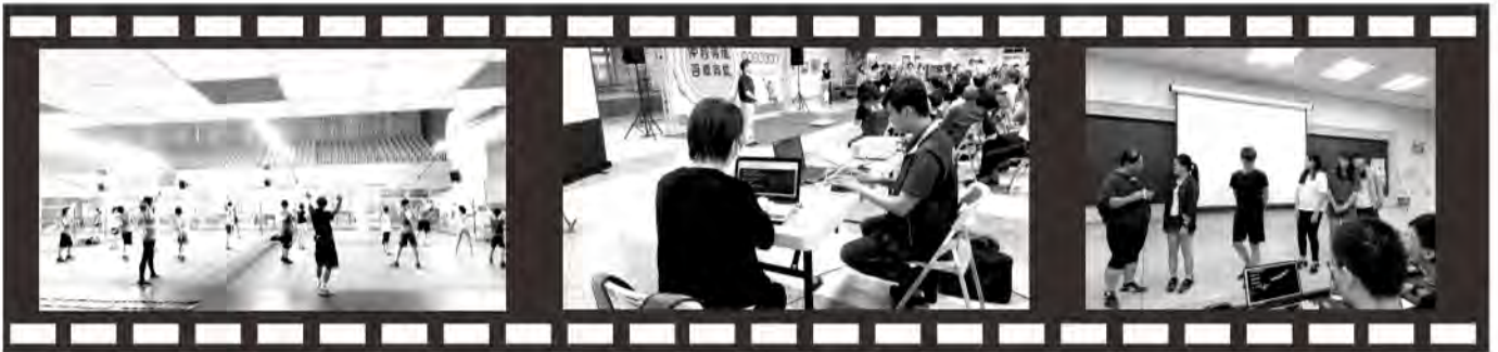
羽球運動培訓班 中秋愛心伴手禮記者會聽打服務 南華大學應用社會學系聽障特教入班宣導