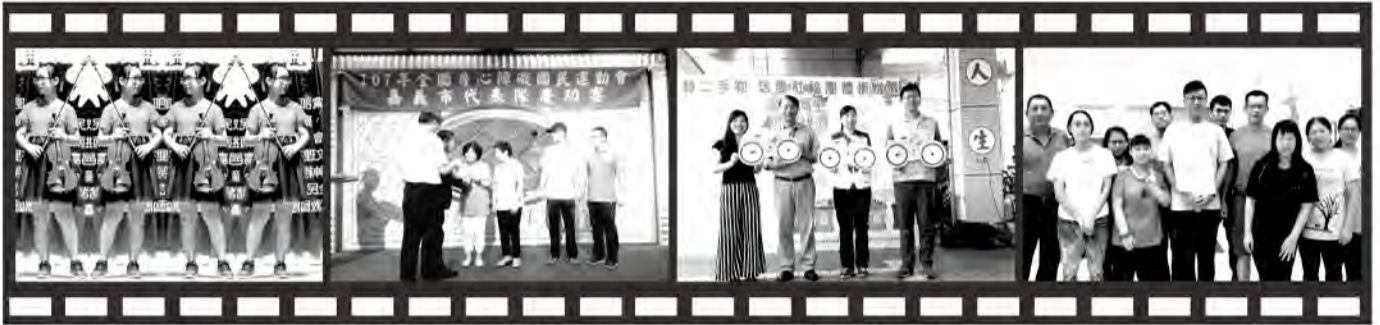
107心心相惜中秋聯歡晚會 (倖孜小提琴演出) 全國身障運動會慶功宴 (姿秀授獎) 環保局「翻轉二手物送愛社福團體」捐贈儀式 保齡球運動培訓班