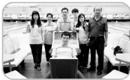
協會代表參加全運會保齡球選手