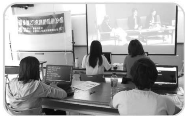
辦理同步聽打培訓