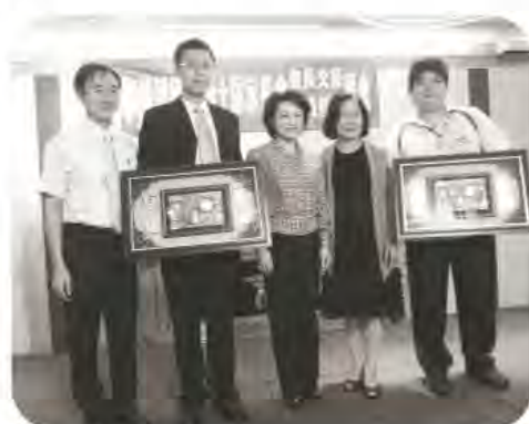
張理事長(左二)榮任嘉義市港坪國小家長會長