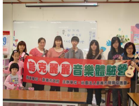
烏克蘭麗的琴音飄揚