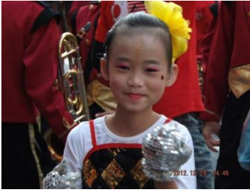
偉孜參加嘉義市國際管樂節踩街