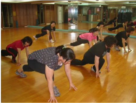
有 FUN 的活力健康律動