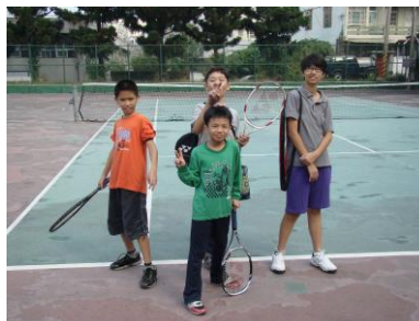
網球培訓班的青年團